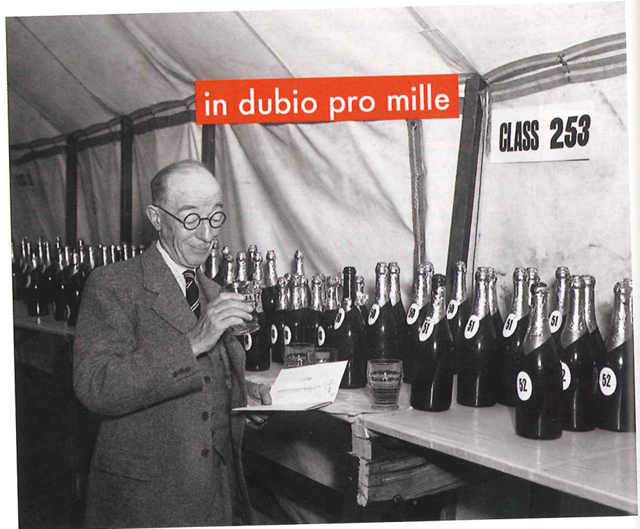
Vom Segen einer Schaumweinverkostung berichtet diese Karte