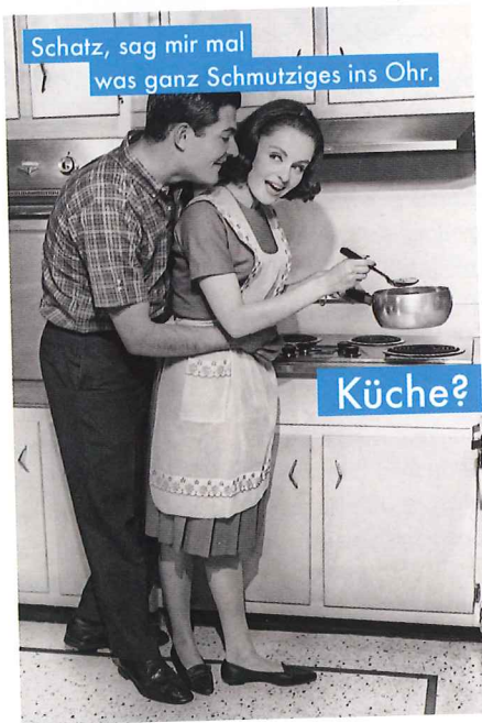
Dirty talk oder dirty work?

S o viele verschiedene Motive nämlich umfasst das einheitliche Konzept „Allerhand!“, das beweist, dass früher alles besser war – und lustiger. Hochwertige Schwarz-Weiß-Fotos, ein kreatives Layout und flotte Sprüche ergeben zusammen die perfekte Mischung zur Aktivierung der Lachmuskeln.