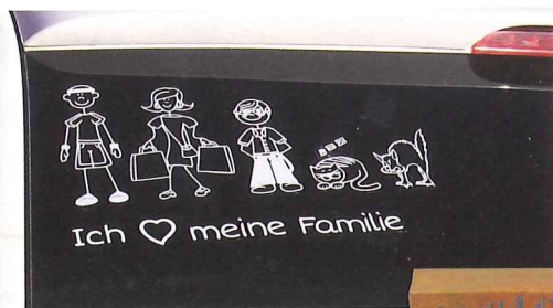
Family Sticker: Autofahrer zeigen ihre Familie