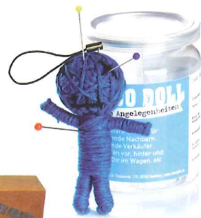
Voodoo Doll: An dieser Puppe kann der Frust bedenkenlos ausgelassen werden