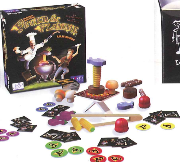
Geschicklichkeitsspiel: Ein Spaß für die ganze Familie