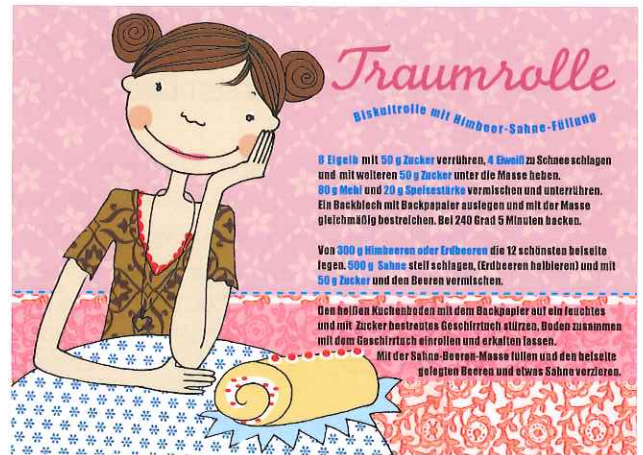
Aus der „Kartenküche“ bei modern times – kreiert von Grafikerin Elke Schillai